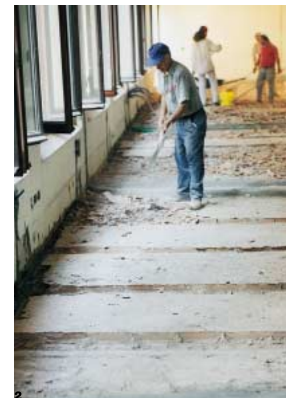
1 - 2. Stato di fatto e fase di smantellamento del sottofondo

Piazza Coperta, vetrata e climatizzata, con un pavimento che consentisse la vista diretta del sottostante foro romano. Direttamente collegata con un'ampia rampa alla piazza del Nettuno, la nuova Piazza Coperta accentua il sistema che vede l'incremento delle piazze concorrenti da due a tre e ripropone ai cittadini le funzioni che venivano prestate nelle città romane delle basiliche. Un luogo di incontro e di interessi coperto e climatizzato, in grado di ospitare manifestazioni di diverso genere e adeguatamente dotato di servizi per favorire la sosta e gli incontri. Dalla piazza coperta si può accedere alla grande Sala di consultazione a scaffale aperto ricavata nelle antiche scuderie del Cardinal Legato. Scale e ascensori collegano la Piazza Coperta con le ampie Sale Collamarini, illuminate da grandi lucernari voltati, alle quali è stata destinata la sede della Nuova Biblioteca Mediateca Comunale, mentre a quelli che erano i box di contrattazione dell'ex Sala Borsa, distribuiti sui ballatoi superiori, è stato affidato il compito di ospitare gli spazi di studio e di consultazione telematica.