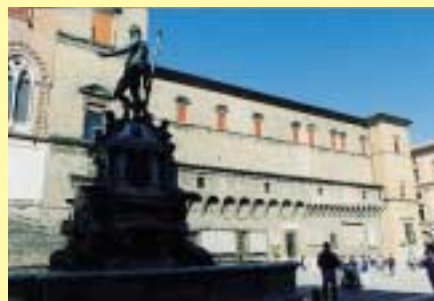
Vista della Sala "ex Borsa" da piazza Maggiore (BO)

Fin dal 1568, il cuore del palazzo-castello del Cardinale Legato, che si ergeva nel centro storico di Bologna, fu trasformato, per opera di Ulisse Aldrovandi, professore dell'Ateneo bolognese, nel secondo orto botanico del mondo, dopo quello di Padova del 1545. Nel 1765 all'orto botanico venne assegnata una nuova sede e questo spazio, che originariamente ospitava al centro la cisterna-pozzo del Terribilia, fu utilizzato per quasi un secolo, come corte di addestramento del corpo dei vigili del fuoco, istituito dopo la Rivoluzione Francese. Fu nel 1883 che il Consiglio Comunale di Bologna autorizzò la costruzione di un complesso architettonico destinato ad ospitare i locali della Borsa di Commercio. Il progetto fu redatto dall'ing. Alfredo Cottrau e dagli ingg. Kohlen e Baubée per le ghise, e la realizzazione delle opere fu affidata all'Impresa Industriale Italiana di Costruzioni Metalliche di Napoli, dello stesso Cottrau. La realizzazione dell'edificio ad un piano, costituito da un padiglione in ghisa e vetro, con un salone centrale ed uffici dislocati lungo il perimetro, fu conclusa nel 1886, mentre le funzioni di "borsa" rimasero attive fino al 1903, anno in cui si stabilì la sospensione delle attività per la scarsità degli affari trattati. Per questo motivo, fino al 1920, l'edificio venne utilizzato come sede di un ristorante, mentre dal 1913 alcuni uffici perimetrali ospitarono la sede di uno sportello della Cassa di Risparmio.