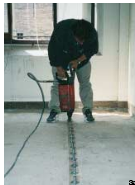
3 - 3a. Fasi di infissione dei Connettori Tecnarina con chiodatrice pneumatica

pa di ripartizione, necessariamente di piccolo spessore (paragonabile con quello dei sottofondi esistenti) per non alterare le quote finite dei pavimenti. Una serie di verifiche preliminari hanno permesso di utilizzare dei connettori a piolo fissati sull'ala superiore delle travi metalliche con chiodatura pneumatica. I connettori a piolo, prodotti dalla società Tecnarina, alti 40 mm e aventi diametro pari a 12 mm sono stati disposti su una sola fila. La soletta ha uno spessore variabile da 5 a 6 cm ed è costituita da una malta a ritiro compensato, altamente fluidificata, in modo da preservare dall'acqua di impasto gli intonaci sottostanti durante la fase di getto.