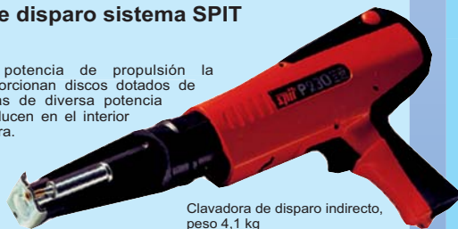
Clavadora de disparo indirecto, peso 4,1 kg y longitud 410 mm

El equipo para la fijación (clavadora accionada por cartuchos explosivos) es muy manejable y fácil de usar. También se puede alquilar y no precisa mano de obra especializada.